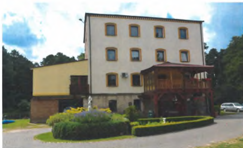
Odnowiony budynek młyna. Obecnie Restauracja Stary Młyn.

Sporządził: Paweł Michalski, Julita Lehmann, Jarosław Ramucki