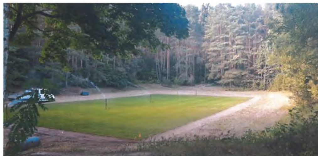
Teren rekreacyjno-sportowy, boisko do piłki nożnej