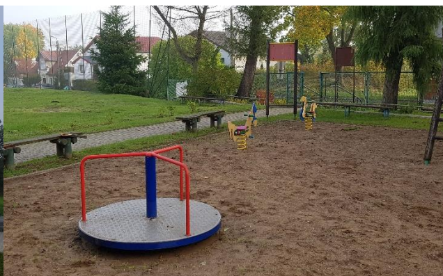
Zdjęcie 7 Wielofunkcyjne miejsce rekreacji – do modernizacji