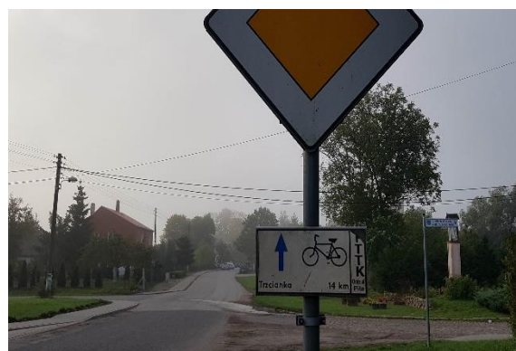
Zdjęcie 5 Oznakowanie niebieskiego szlaku rowerowego

Sołectwo Róża Wielka tworzą trzy miejscowości: Róża Wielka, Róża Mała oraz Różanka. Wieś położona jest w województwie wielkopolskim, w powiecie pilskim, w gminie Szydłowo, 17 km od Piły, 14 km od Wałcza, 14 km od Trzciánki. Miejscowość leży na płaskim obniżeniu terenu (na północ i południe od wsi teren jest 10 metrów wyższy). Sołectwo malowniczo otoczone polami uprawnymi, w pobliżu lasy – prawdziwy raj dla grzybiarzy i miłośników przyrody, zwierząt i ptaków, wielbicieli naturalnego miodu i czystego powietrza. Rejon ten nazwano Różewskie Łozowisko. Jest to użytek ekologiczny, zasługujący na ochronę pozostałości ekosystemów. Odnajdujemy tu naturalne zbiorniki wodne, bagna, torfowiska, siedliska przyrodnicze oraz stanowiska rzadkich lub chronionych gatunków roślin, zwierząt i grzybów. Wokół wsi jest dużo wybudowań; tereny są urodzajne i pagórkowate. Najwyższe wzniesienie w okolicy na drodze do Różewa sięga 163 m n.p.m. Przy drodze do Leżenicy leży Różanka (dawny Rosengut, jeszcze wcześniej zwany Żurawim Ostrowem). Przez miejscowość przebiega niebieski szlak rowerowy cieszący się dużym zainteresowaniem ze względu na mały ruch samochodowy i ciekawy krajobraz. Liczne polne drogi wykorzystywane są do nordic walking i trenowania biegania. Sołectwo Róża Wielka liczy ok 500 mieszkańców. Obecnym Sołtysem Sołectwa i zarazem Radną Gminy Szydłowo jest Iwona Kwaśniak.