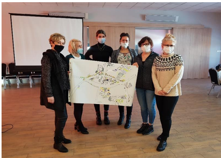
Zdjęcie 12 Praca grupowa – prezentacja wizji rozwoju sołectwa