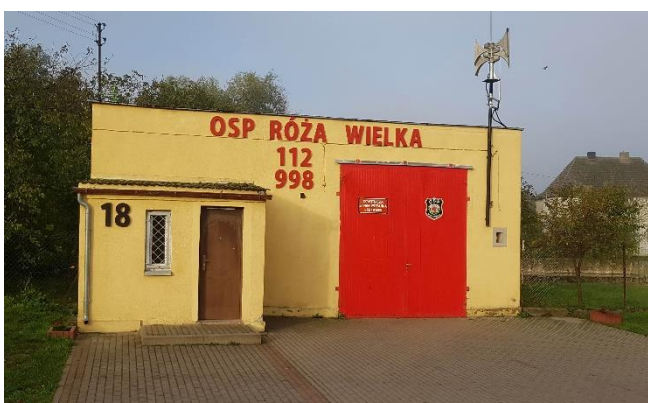
Zdjęcie 8 Budynek OSP Róża Wielka