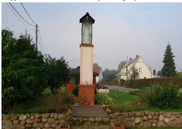
Zdjęcie 11 Kapliczka przydrożna