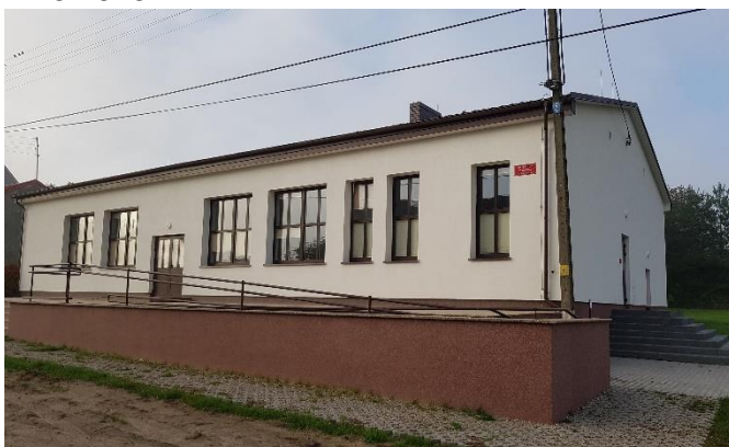
Zdjęcie 6 Budynek świetlicy wiejskiej