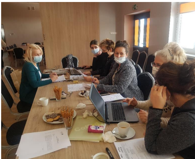
Zdjęcie 2 Warsztaty pisania SSR – luty 2021

Drugie warsztaty odbyły się w dniu 14.02.2021 roku. Warsztaty w tym dniu polegały na wykazaniu, na podstawie przeprowadzonych wcześniejszych analiz, zamierzeń projektowych. Tak powstał plan długo i krótkoterminowy. W planie krótkoterminowym wskazano te projekty/zadania, które mieszkańcy sołectwa planują zrealizować w pierwszej kolejności – w okresie 12 miesięcy. Następnie w ramach planu długoterminowego zaplanowano zadania na lata przyszłe. W planie długoterminowym wskazano cele jakie sołectwo stawia sobie do osiągnięcia, w poszczególnych kategoriach potencjału rozwojowego.