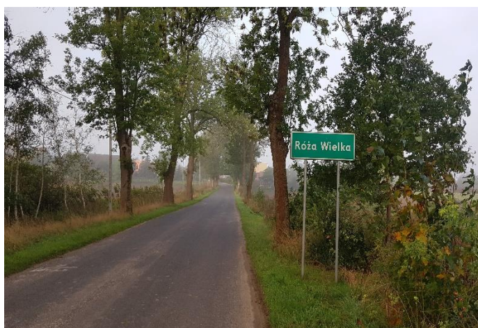
Zdjęcie 1 Wjazd do miejscowości Róża Wielka