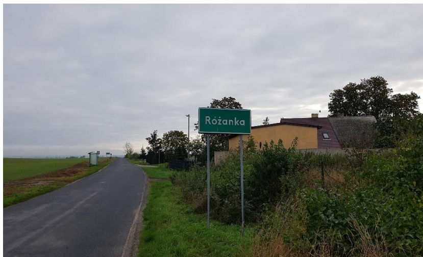
Zdjęcie 4 Wjazd do miejscowości Różanka, jednej z trzech w sołectwie Róża Wielka

Sołectwo Róża Wielka tworzą trzy miejscowości: Róża Wielka, Róża Mała oraz Różanka. Wieś położona jest w województwie wielkopolskim, w powiecie pilskim, w gminie Szydłowo, 17 km od Piły, 14 km od Wałcza, 14 km od Trzciánki. Miejscowość leży na płaskim obniżeniu terenu (na północ i południe od wsi teren jest 10 metrów wyższy). Sołectwo malowniczo otoczone polami uprawnymi, w pobliżu lasy – prawdziwy raj dla grzybiarzy i miłośników przyrody, zwierząt i ptaków, wielbicieli naturalnego miodu i czystego powietrza. Rejon ten nazwano Różewskie Łozowisko. Jest to użytek ekologiczny, zasługujący na ochronę pozostałości ekosystemów. Odnajdujemy tu naturalne zbiorniki wodne, bagna, torfowiska, siedliska przyrodnicze oraz stanowiska rzadkich lub chronionych gatunków roślin, zwierząt i grzybów. Wokół wsi jest dużo wybudowań; tereny są urodzajne i pagórkowate. Najwyższe wzniesienie w okolicy na drodze do Różewa sięga 163 m n.p.m. Przy drodze do Leżenicy leży Różanka (dawny Rosengut, jeszcze wcześniej zwany Żurawim Ostrowem). Przez miejscowość przebiega niebieski szlak rowerowy cieszący się dużym zainteresowaniem ze względu na mały ruch samochodowy i ciekawy krajobraz. Liczne polne drogi wykorzystywane są do nordic walking i trenowania biegania. Sołectwo Róża Wielka liczy ok 500 mieszkańców. Obecnym Sołtysem Sołectwa i zarazem Radną Gminy Szydłowo jest Iwona Kwaśniak.