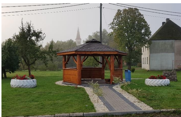
Zdjęcie 9 Zadaszona altana – miejsce integracji mieszkańców