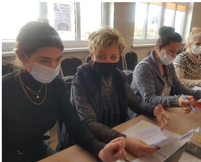
Zdjęcie 3 Warsztaty pisania SSR – luty 2021

Przedstawiciele Grupy odnowy wsi wykonali również graficzną wizję miejscowości – którą następnie zaprezentowali pozostałym uczestnikom warsztatów.