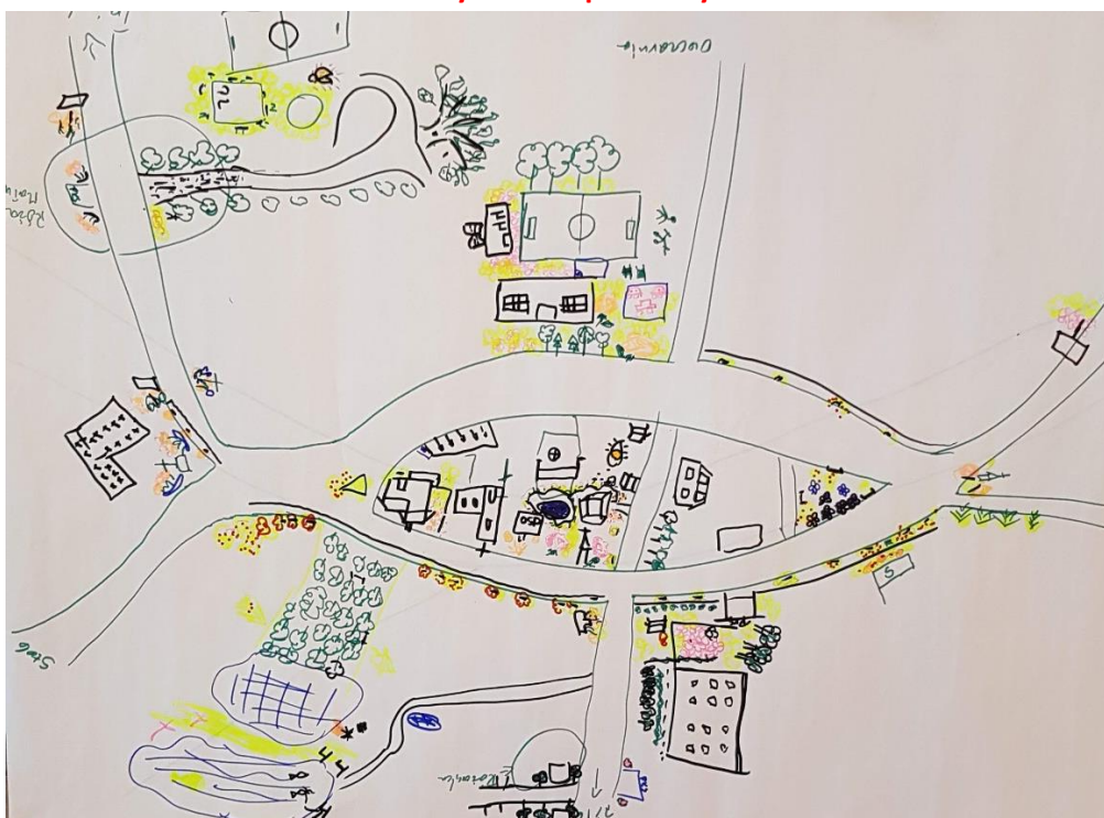
Zdjęcie 13 Wizja obrazkowa miejscowości wykonana podczas warsztatów przez Przedstawicieli GOW

Róża Wielka otworem stoi Wszystkich ugości i chętnie napoi. W niej wszyscy radośni i uśmiechnięci Płatkami róż obsypują gości Wśród lasów zielonych i pól mozaikowych Wioska z tematem róż kolorowych. Przyjedźcie, zobaczcie Wszystkich zapraszamy!