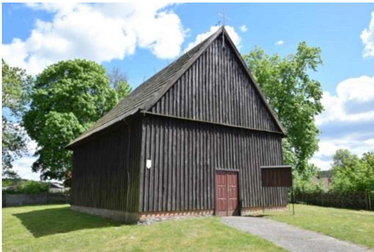
Ryc. 3 Kościół pw. św. Jana Chrzciciela w Zawadzie

katolicki pw. Matki Boskiej Nieustającej Pomocy w Szydłowie oraz kościół par. pw. Podwyższenia Krzyża Św. w Starej Łubiance. Są to świątynie murowane, w większości o ceglanych elewacjach, ich architektura zainspirowana jest popularnymi w tym czasie formami neogotyku i neoromanizmu.