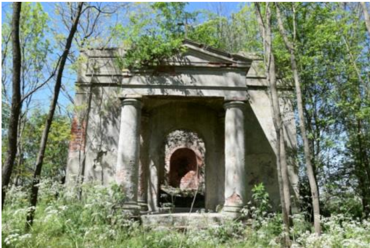
Ryc. 4 Kaplica grobowa rodu Żychlińskich w Kłęśniku

Zespół dworsko-parkowy w Starej Łubiance znajduje się w coraz lepszym stanie technicznym, w 2014 roku zakończono remont kapitalny dworu. Dwór w Nowym Dworze utrzymywany jest w dostatecznym stanie. Dwory w Kotuniu, Jaraczewie i Skrzatuszu wymagają podjęcia prac remontowych. Uzupełnieniem historycznej architektury są zachowane wokół nich parki.